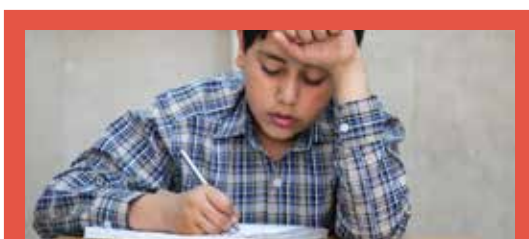
علاقه به کتاب، داستان‌ها و مقالات، دفتر یادداشت و خاطره‌نویسی در افراد دارای گرایش به هوش کلامی بیشتر است

خواندن، نوشتن، بازی با کلمات و داستان‌سرایی علاقه‌مندند و به ابزارهای نوشتاری، کتاب، داستان‌ها و مقالات، دفترهای یادداشت و خاطره‌نویسی، مکالمه و مباحثه، بیان پرحرارت آنچه می‌دانند و نقل خاطراتشان توانمندی، گرایش و علاقه نشان می‌دهند.