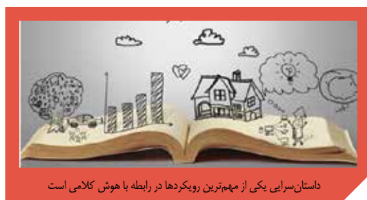
داستان‌سرایی یکی از مهم‌ترین رویکردها در رابطه با هوش کلامی است

داستان‌سرایی یکی از مهم‌ترین رویکردها در این باره است و توجه به آن را در بسیاری از برنامه‌های مدرسه می‌توانیم مدنظر داشته باشیم. بسیاری از خاطرات ما از محتواهای درسی گذشته که در ذهنمان باقی مانده‌اند، موضوعاتی هستند که داستان‌گونه به ما منتقل شده‌اند.