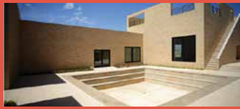
حیاط یک مدرسه در بسطام که کانون توجه، همچون گود زورخانه، در یک قمر یا فرورفتگی فضایی قرار می‌گیرد.