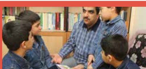
خواندن بخش‌هایی از یک کتاب برای معرفی آن یا هر هدف دیگری از سازنده‌های ظرفیت هوش کلامی

طراحی فضاهایی برای کتاب‌خوانی، یکی دیگر از محورهای توسعه توجه به هوش زبانی در معماری مدرسه است. در اینجا منظور از کتاب‌خوانی، خواندن کتاب یا مطالعه آن نیست، بلکه بلندخواندن بخش‌هایی از یک کتاب برای معرفی آن یا هر هدف دیگری است که خواننده آن کتاب می‌خواهد با مخاطبان خود به اشتراک بگذارد. واژه «شاهنامه‌خوانی» برای همه ما معنایی روشن دارد که از دیرباز در فرهنگ ما وجود داشته است و در برخی فضاهای عمومی مانند قهوه‌خانه‌ها، فضایی خاص برای آن طراحی و پیش‌بینی می‌شده است. اگر در بخشی از کتابخانه یا هر محیط دیگری از مدرسه، فضایی به کتاب‌خوانی اختصاص داده شوند، هم به گسترش فرهنگ کتاب‌خواندن کمک می‌شود، هم کتاب‌های متعدد به دیگران معرفی می‌شوند، هم اشتراک‌گذاری محتوای کتاب‌ها به شکل گزینش شده (توسط کسانی که آن را مطالعه کرده‌اند) صورت می‌گیرد و هم به رشد هوش کلامی و زبانی کمک می‌شود.