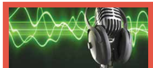
رادیو مدرسه یا فضایی برای تولید پادپخش و محتوای صوتی توسط خود دانش‌آموزان

یکی از امکاناتی که بعضی از مدرسه‌ها در دوران همه‌گیری کرونا آن را برای خود فراهم کردند، فضاهایی برای تولید و ضبط محتوای درسی به شکل صوتی و تصویری بودند. این نوع فضاها در این شرایط هم که از کرونا عبور کرده‌ایم می‌توانند با عنوانی دیگر مانند «رادیو مدرسه» حفظ یا احیا شوند. فضاهایی هر چند کوچک و نه الزاماً حرفه‌ای که برای استفاده دانش‌آموزان، به منظور انجام فعالیت با محور تولید محتوای آموزشی مانند کتاب‌های صوتی یا پادپخش (پادکست)‌هایی با موضوعات علمی و حتی نقل داستان و خاطرات، یا اخبار مدرسه مناسب هستند. ایجاد این فضاها کمک می‌کند زمینه‌ای دیگر برای توجه به هوش زبانی و کلامی در فضاهای مدرسه فراهم باشد. این فضا می‌تواند ضمن اینکه تا حدودی آوایی است، پنجره‌ای شفاف شبیه «هنرگاه» (استودیو)های ضبط صدا داشته باشد.