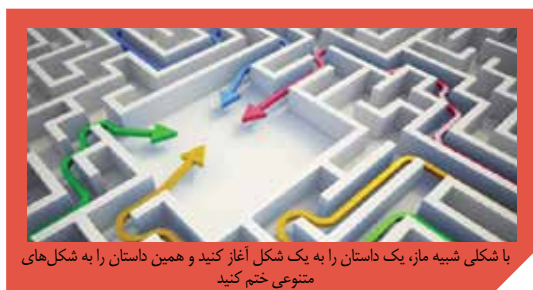
با شکلی شبیه ماز، یک داستان را به یک شکل آغاز کنید و همین داستان را به شکل‌های متنوعی ختم کنید

یک آغاز مشترک و نقد و تحلیل آن‌ها می‌تواند به صورتی کاملاً گیرا، گرایش‌های موجود در هوش کلامی و زبانی دانش‌آموزان را به فعلیت درآورد و به رشد آن‌ها کمک کند. هرچند این ایده به کمک معماری واقعی در محیط قدری مشکل به نظر می‌رسد، اما چندان بعید نیست که با روش‌های خلاقانه و استفاده از مصالح به نسبت ارزان‌تر، بتوان به آن پرداخت. شاید یک ماز بدون دیوار و با ترسیم خطوط در رنگ‌های معنادار روی زمین هم قابلیت خلق شدن پیدا کند. معلمان خلاق و پیشرو با واژه‌های «نمی‌توان» یا «نمی‌شود»، رابطه خوبی ندارند.